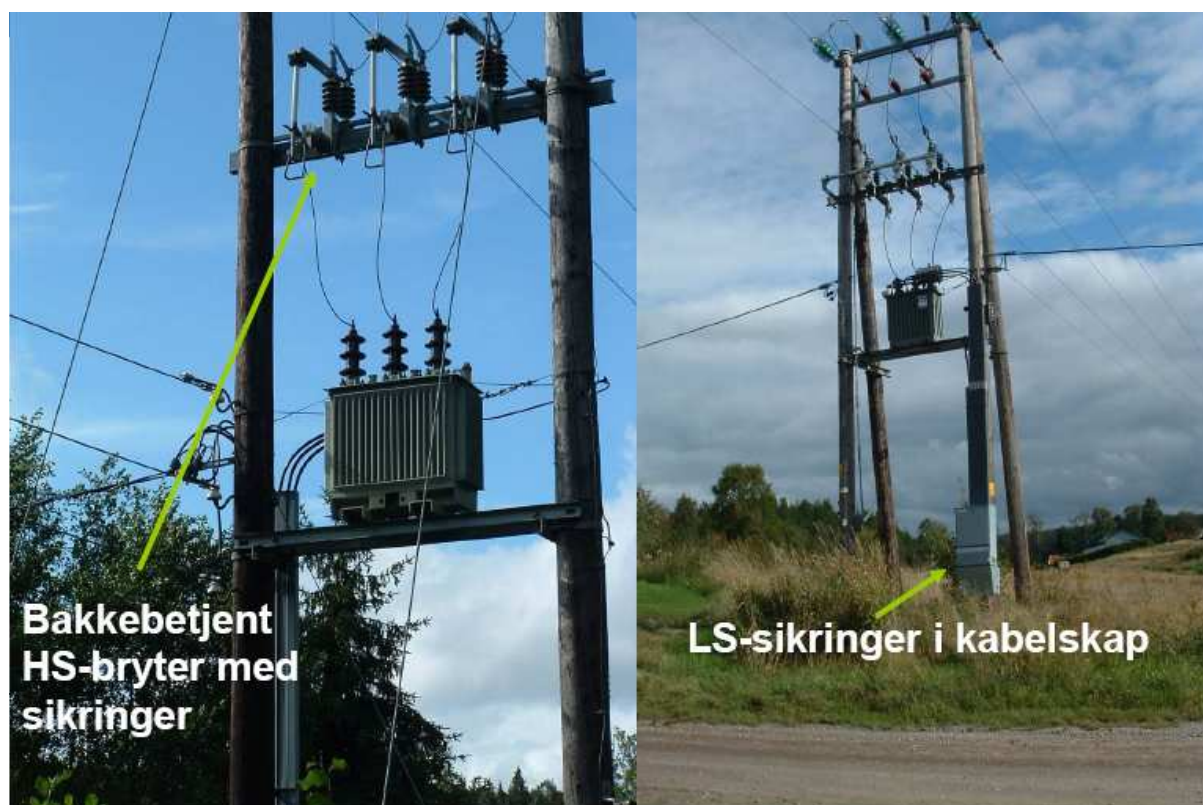
Bilde 2: Sikrings arrangement som er godkjent etter de nye forskriftene.