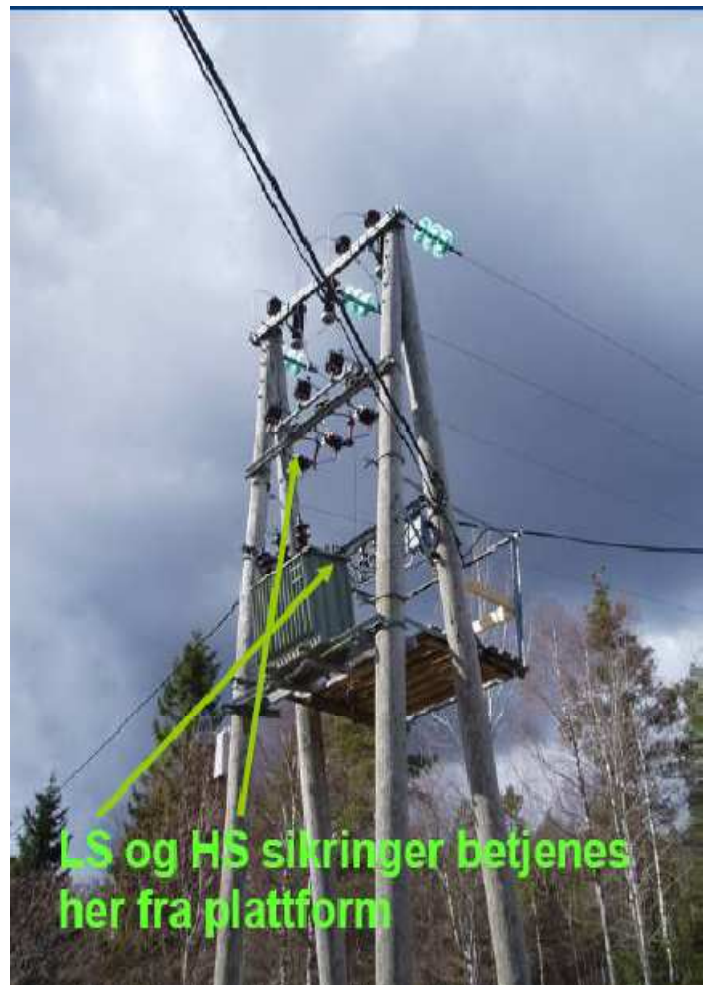
Bilde 1: Sikrings arrangement som ikke er godkjent etter de nye forskriftene. (Prosjekt presentasjon, Fortum)

Fra og med 2016 har denne nye forskriften tilbakevirkende kraft, og alle nettstasjonene, nye som gamle, må da kunne betjenes fra bakken. For å komme dette problemet i forkjøpet har Fortum bestemt seg for å sette opp en prioritering for ombygging.